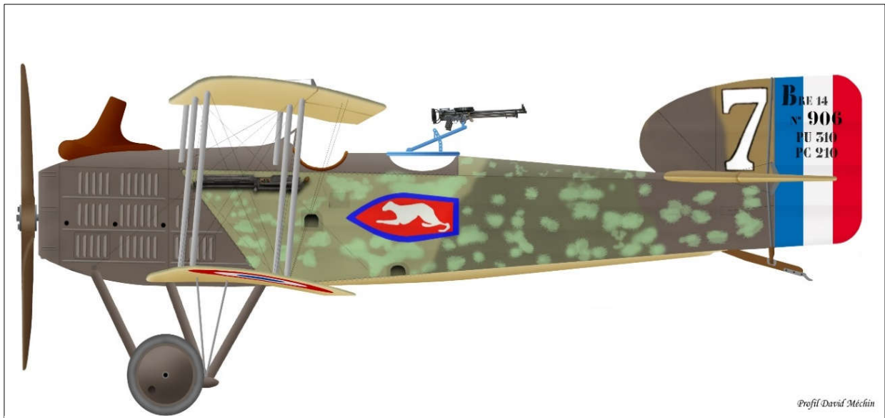
Breguet n°906 type 14 A2. Escadrille 45

Pertes : 1 avion abattu ; 1 avion brisé au départ. Le GB 4 a effectué 40 sorties, lancé plus de 8 tonnes de projectiles, abattu 2 avions ennemis.